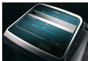
DOTYKOVÝ PANEĽ S LED INDIKÁTORY

Funkce stroje se aktivují pouhým dotykem ovládacích prvků. Elektronické řízení výkonu EPC: zobrazuje zatížení při skartování potřebné k optimalizaci skartování bez záseků papíru.