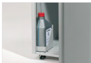
INTEGROVANÝ SYSTÉM AUTOMATICKÉHO MAZÁNÍ

Funkce stroje se aktivují pouhým dotykem ovládacích prvků. Elektronické řízení výkonu EPC: zobrazuje zatížení při skartování potřebné k optimalizaci skartování bez záseků papíru.