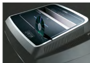
ŘEZNÁ JEDNOTKA CD/DVD A DVĚ SAMOSTATNÉ SADY ŘEZNÝCH NOŽŮ

Automatické mazání eliminuje potřebu ručního mazání jednotky. Chrání nože antikoroziními prostředky a zajišťuje maximální spolehlivost.