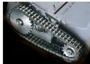
SUPER SILNÝ SYSTÉM

Osvětlené indikátory pro úsporu energie v pohotovostním režimu. Snadno ovladatelný spínač On/Off/Reverse s LED signalizací plného vaku a/nebo otevřených dvířek.