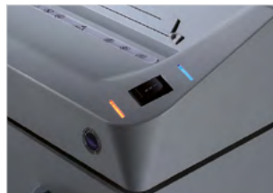
ENERGY SMART SYSTEM

Tepelná ochrana motoru. Motor s nepřetržitým provozem bez přehřátí. Integrovaná klapka pro skartování disků CD, DVD, disket a kreditních karet.