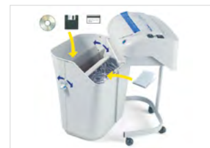
POHODLNÁ VYJÍMATELNÁ ODPAVNÍ NÁDOBA

Stisknutím spínače Turbo se skartovací kapacita stroje zvýší o 30 %.