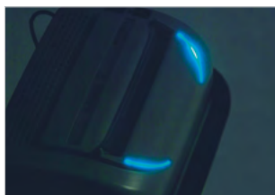
MOTOR S 24 HODINOVÝM NEPŘETRŽITÝM PROVOZEM

Teplná ochrana motoru. Motor s nepřetržitým provozem. Optické světelné indikátory pro úsporný pohotovostní režim.