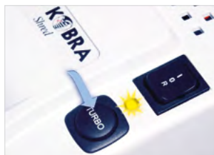
SYSTÉM TURBO BOOST

Super silný systém s ocelovými převody, které nabízejí spolehlivost a odolnost proti opotřebení. Řezné nože z uhlíkově kalené oceli jsou odolné proti sešivacím a kancelářským sponkám.