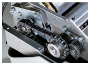
SUPER SILNÝ SYSTÉM

Teplná ochrana motoru. Motor s nepřetržitým provozem. Optické světelné indikátory pro úsporný pohotovostní režim.